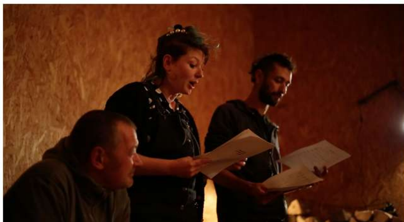
Lecture d'une Usine